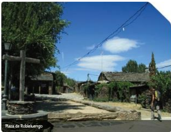
Plaza de Robleluengo

dencia como consecuencia de los edificios que aún se encuentran en ruinas.