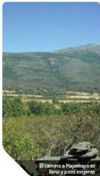
El camino a Majaelrayo es llano y poco exigente

impronta en la vestimenta típica que lucen los danzantes en el baile de la Fiesta del Santo Niño y que consiste en pantalón y blusa blanca cruzada por bandas roja y verde en forma de aspa que tanto recuerda a la bandera autonómica vasca.