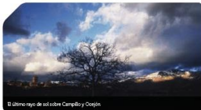
El último rayo de sol sobre Campillo y Ocejón.

Campillo de Ranas nos deleita con su armonioso casco urbano , muy cuidado y mejorado durante las últimas dos décadas. Su anacrónica zona residencial, afortunadamente, se encuentra muy distanciada del núcleo histórico que día a día, gracias al esfuerzo de sus habitantes y autoridades, va recuperando el esplendor alcanzado por esta villa serrana en siglos pasados.