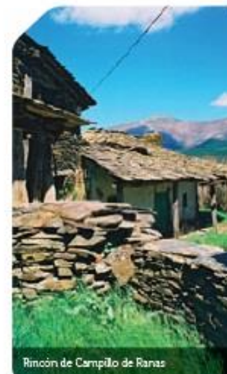
Rincón de Campillo de Ranas

arroyo del Agua Fría, junto al que discurre la mayor parte de camino con destino a este barrio de Campillo. Una hermosa saucedada esconde el curso del agua que, cada poco, se descalabra en una sucesión de pequeñas cascadas. Se camina al pie de suaves colinas colapsadas por interminables masas de jaras y estepas ( Cistus Ladanifer L y Cistus Laurifolia L ), las hechuras del camino fuerzan la fila india y la máxima atención para no tropezar con el escabroso firme.