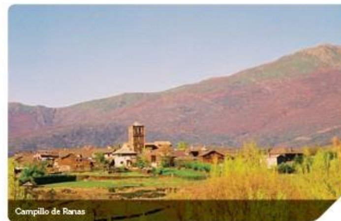
Campillo de Ranas

Junto al panel de inicio de ruta se encuentra el viejo reloj de sol que durante tantos años dio servicio a los pobladores de este burgo. El primer paso del caminante será buscar la recogida plazuela que se encuentra a la espalda de la iglesia, donde se ubica el edificio de la escuela que hoy en día, tras