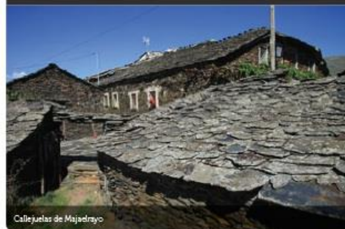
Callejuelas de Majaelrayo

Majaelrayo está rodeado de parajes singulares entre los que destacan el Pico Ocejón (2.058 m.), al que se puede ascender desde el pueblo (camino CM1); el pico Campachuelo, algo más bajo que el Ocejón; la ribera del río Jaramilla; y el arroyo y cascada de la Matilla.