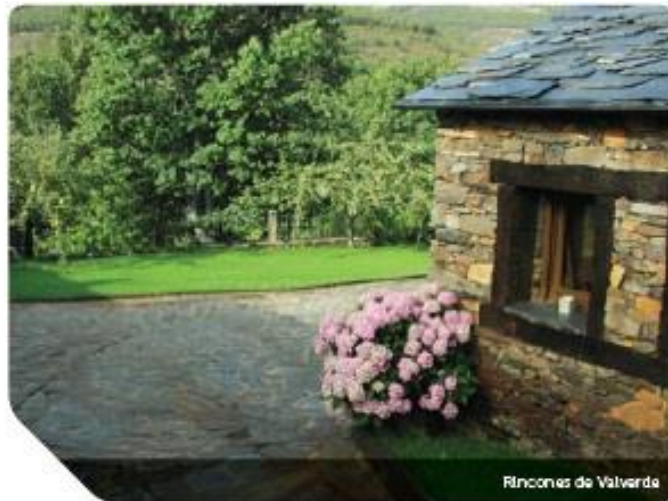
Rincones de Valverde

biente de espesa vegetación, reino de zarzas ( Rubus Ulmifolius Shott ) y majuelos ( Crataegus monogyna Jacq ) que los pobladores de estas tierras supieron aprovechar desde siempre, tanto en la degustación de sus frutos como en su uso como plantas medicinales y melíferas.