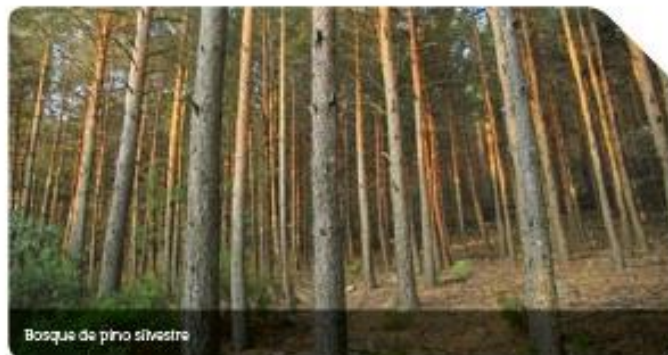
Bosque de pino silvestre

La pista comienza a ascender por la Loma del Lomo buscando la Majada de los Cardos a través de un característico collado cercano a la cota 1500 m. El caminante está rodeado de un frondoso bosque de pino silvestre ( Pinus sylvestris L )