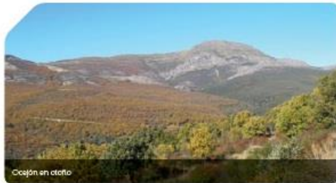
Ocejón en otoño

La plaza Mayor de Valverde de los Arroyos es, sin duda, uno de los lugares más característicos y representativos de la Arquitectura Negra de Guadalajara. En esta plaza se encuentra una tosca y bella iglesia que alberga una antigua Cruz Procesional del siglo XVI realizada por el orfebre Diego Valle, oriundo de Segovia.