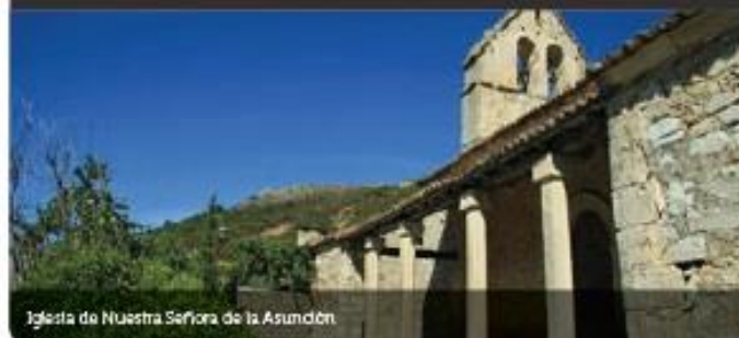
Iglesia de Nuestra Señora de la Asunción

Presidiendo la Plaza del Pilar se encuentra la Fuente Vieja, como la conocen las gentes del pueblo, construida en 1794 en honor al rey Carlos IV en cuyo sillar triangular de remate figura la inscripción "REI CARLOS IV".