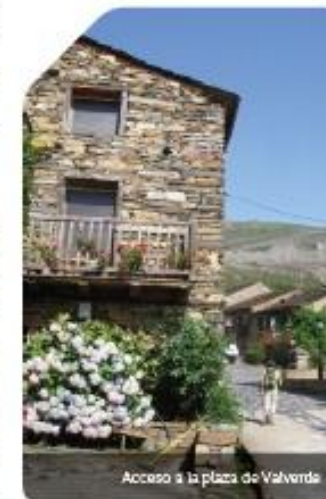
Acceso a la plaza de Valverde

Al poco de cruzar el arroyo, el camino converge durante escasos 50 metros con la carretera general, que abandona por un carril que parte a la derecha de la misma, en un am-