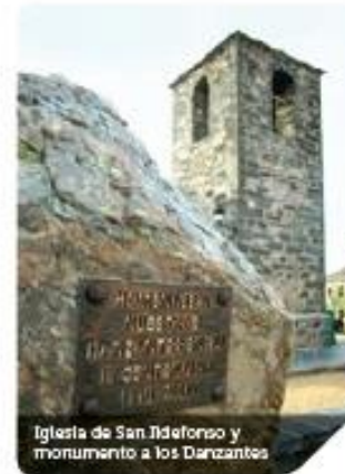
Iglesia de San Ildefonso y monumento a los Danzantes

productos de la tierra. Los acusados desniveles sobre los que se asienta esta villa le obligarán a caminar por un sube y baja de recoletas calles donde descubrir mil rincones pintorescos que llenarán su cámara de inolvidables recuerdos.