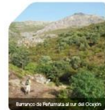
Barranco de Peñamita al sur del Ocejón

Poco a poco el camino va perdiendo cota y tras cruzar el robledal aparece un bosque mixto donde las sabinas ( Juniperus Thurifera L ) y los enebros ( Juniperus oxicedrus