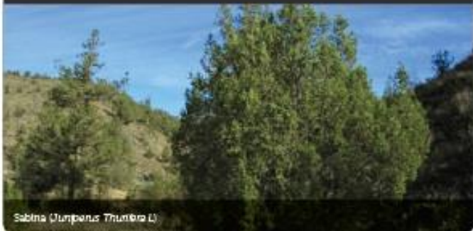
Sabina ( Juniperus Thunbergii L)

El paisaje cercano cambia radicalmente al atravesar la zona de falla cercana a este municipio, siendo las calizas los materiales predominantes que configuran un paisaje alomado donde la erosión kárstica ha modelado una "ciudad encantada" y donde se suceden cuevas y simas. En estas condiciones, una enorme mancha de sabinas y enebros configuran uno de los mayores y mejor conservados sabinares de nuestro país.