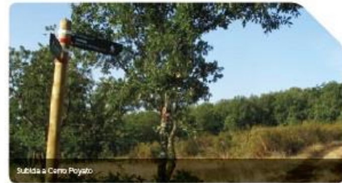
Subida a Cerro Poyato

Se despeja el paisaje, en el horizonte se advina la comarca de la Ribera y más al sur, la Alcarria. El paisaje es amplio, inmenso; al vi-