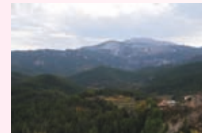
Vistas del Hueco de Tus y Calar de la Sima.

Continuaremos rumbo al castillico, subiremos hasta la aldea que hay más arriba del Batán, Los Hajjaderos y junto a las casas que encontramos a nuestra izquierda sale una senda que sube en poco más de medio kilómetro hasta el cerro donde encontramos las ruinas de la antigua construcción.