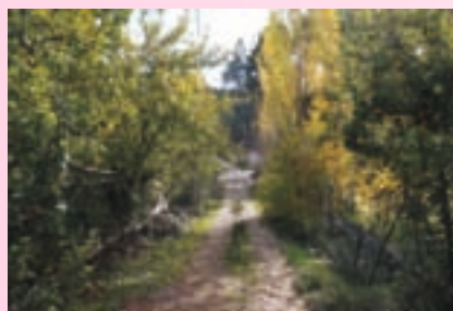
Membrilleros en el Batán

Los Giles, Pedazuelo, La Casica, Tus, El Carrascal, El Villar... y vuelve a bajar hasta encontrarse de nuevo con la carretera del río a la altura de los Baños. A la izquierda la carretera llega hasta las aldeas de Collado Tornero y la Moheda. Para este recorrido tomaremos como primer tramo la carretera que sube hasta la aldea de los Giles, es la aldea más habitada de todo el hueco, en ella encontraremos panadería, tienda, bar y una gran variedad de dulces caseros. Ya en la aldea de Los Giles, justo enfrente del centro social y de la parada del autobús, continua la ruta entre las casas, baja hasta el arroyo de la Sierra cruzándolo por un puente que nos encontraremos, para adentrarnos por la espesura tupida del frondoso bosque que aquí se forma, donde la humedad y el tipo de suelo hacen que se cree un microclima propio que hacen que se instalen plantas características del bosque mediterráneo. El bello paisaje que recorreremos siempre hará pararnos con cada cosa que observemos. Llegaremos a las ruinas del cortijo de Cañada Santilla y giraremos para seguir nuestro camino entre el pinar de pino rodeno, jaras y brezos que cubren el sotobosque hasta las casas del Batán, de nuevo junto al arroyo de la Sierra. Desde el Batán ya vemos hacia el norte el cerro donde se levantaba el castillico de Tus, destino de nuestra ruta.