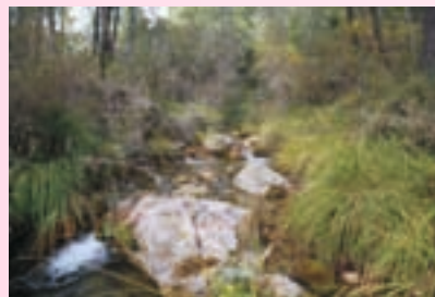
Arroyo de la Sierra

En el Hueco de Tus, comienza esta ruta, justo en el puente que cruza el arroyo de la Sierra junto a la carretera que transcurre junto a río. Es en este punto donde la carretera se bifurca, hacia la derecha recorriendo las aldeas del hueco de Tus,