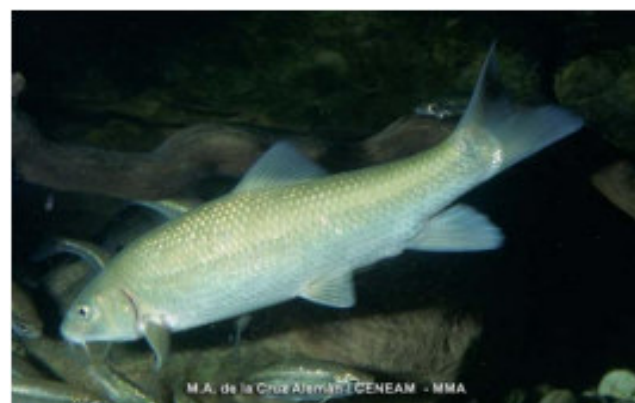
M.A. de la Cruz Alemán / CENEAM - MMA