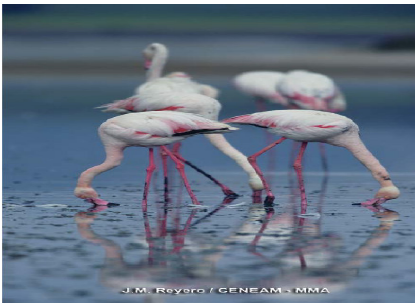
Flamenco común ( Phoenicopterus roseus )