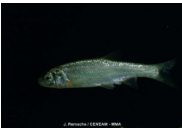
J. Remacha / CENEAM - MMA